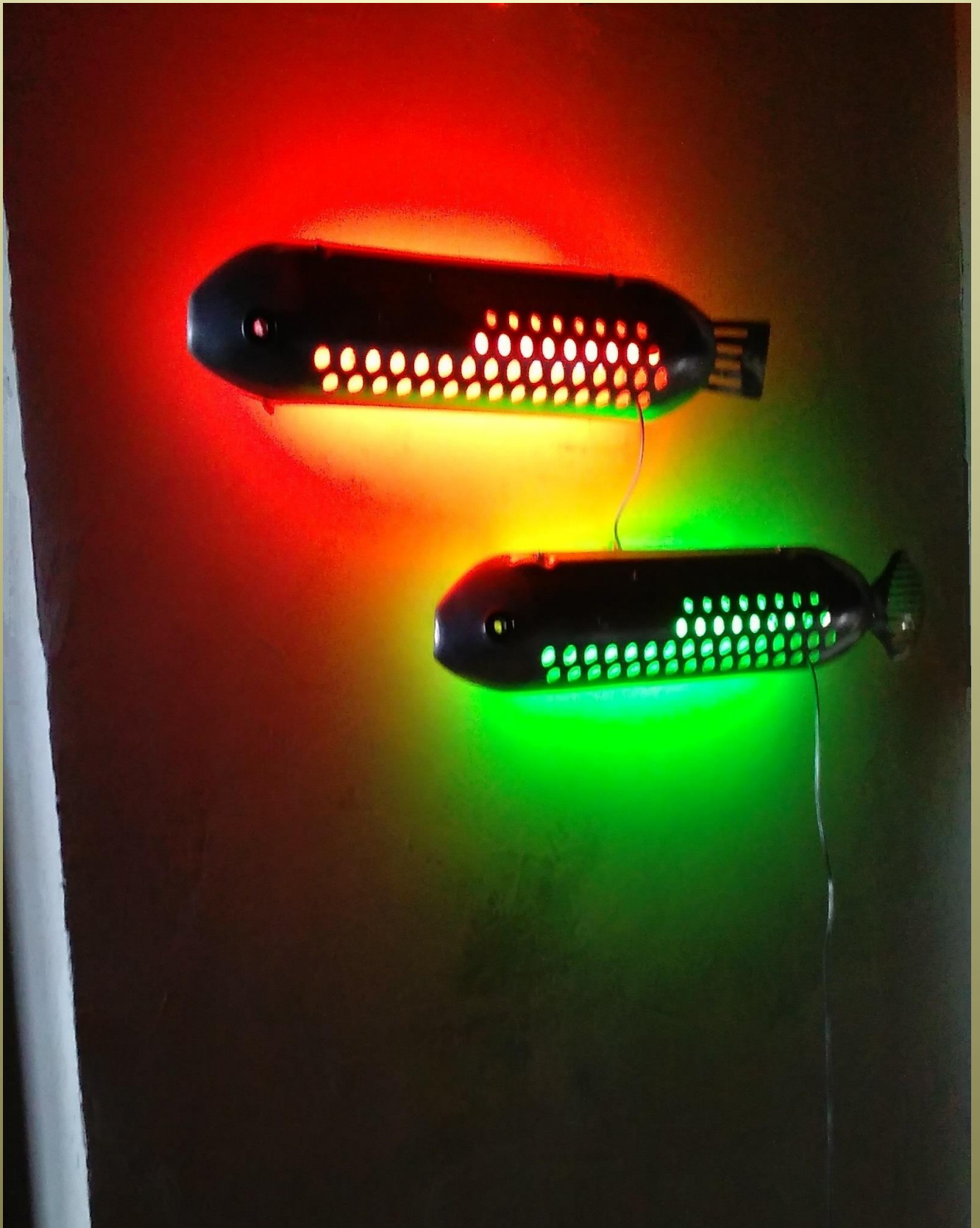
Fish – lamp montate su parete